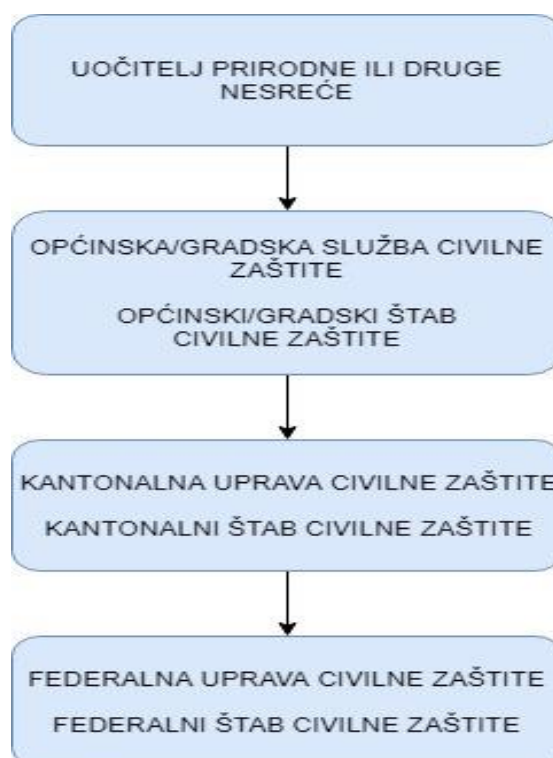
Shema 1.: Organizacijska shema upravljanja akcijom zaštite i spašavanja

Aktiviranje postrojbi civilne zaštite za protupožarnu zaštitu, vatrogasnih društava susjednih općina, pripadnika vojske BiH te međunarodne pomoći je nešto složeniji proces te zahtjeva određene predradnje.